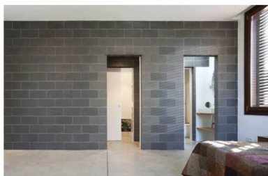
ผนังก่ออิฐมวลเบา